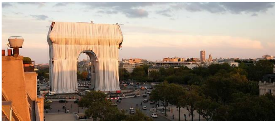
L'Arc de Triomphe de Paris emballé par Christo. L'œuvre suscite les débats

Haut-Rhin : Des archéologues découvrent des vestiges de l'Antiquité inédits en Alsace