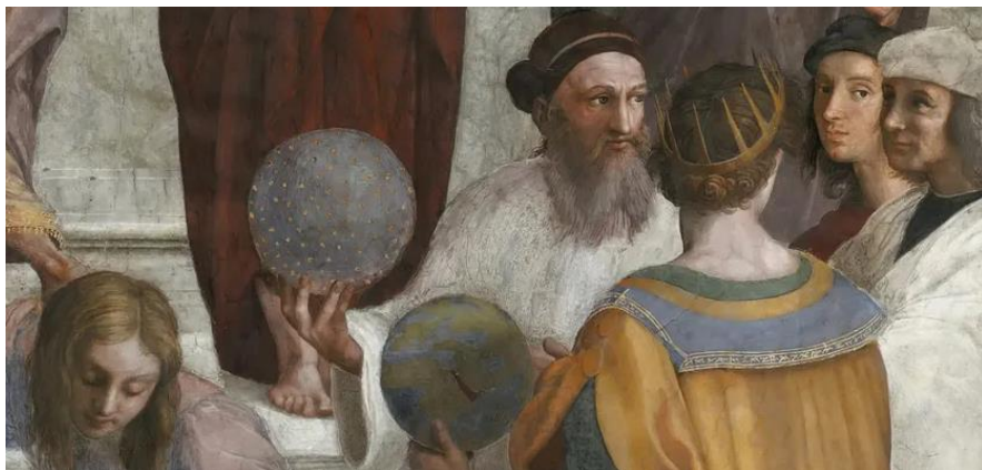
Détail de la fresque "L'École d'Athènes" de Raphaël, montrant Zoroastre et Ptolémée en bas à droite (environ 1510-1511)