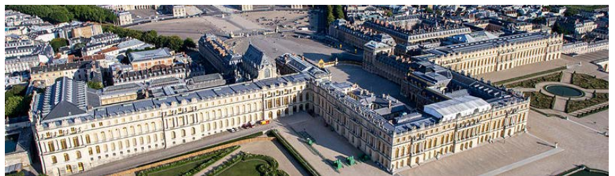
Vue aérienne du domaine de Versailles