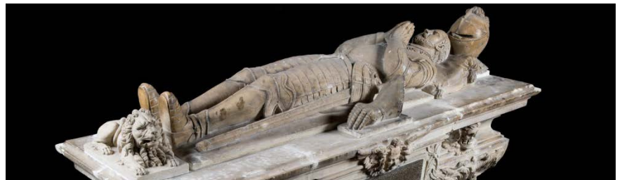
Cénotaphe de Michel de Montaigne (1533-1592) à Bordeaux

Retour en images sur l'impressionnante «aqua alta» qui a submergé Venise