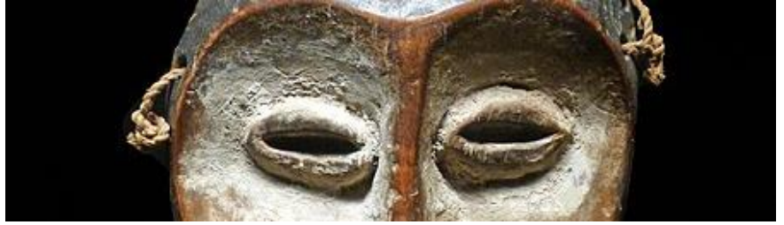
Petit masque facial anthropomorphe Lega au Musée du Quai Branly