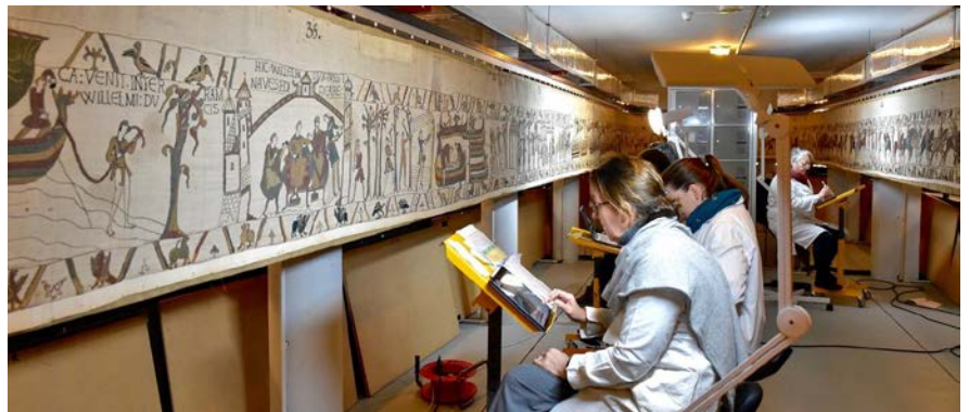
Tapisserie de Bayeux, constat janvier 2020