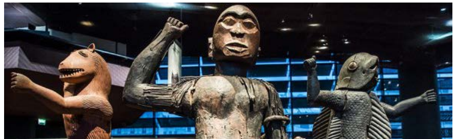
Statues royales de l'ancien Dahomay, actuel Bénin exposées au Musée du Quai Branly