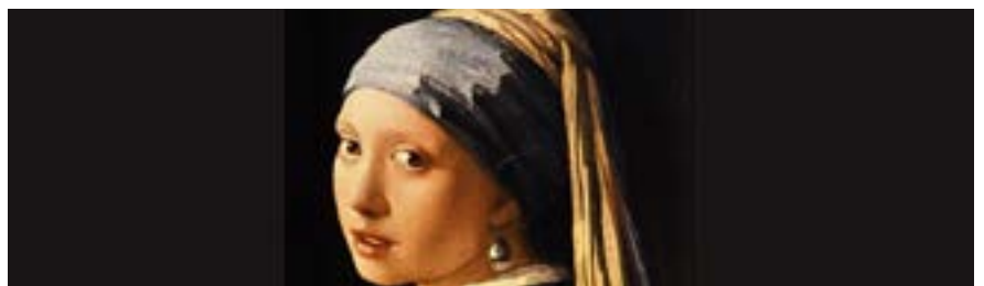
La Jeune Fille à la perle de Johannes Vermeer