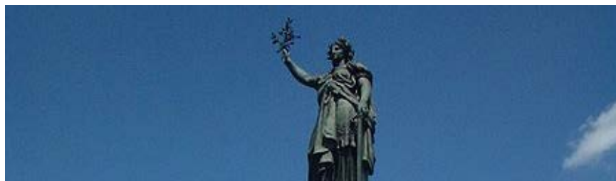
Statue place de la République à Paris