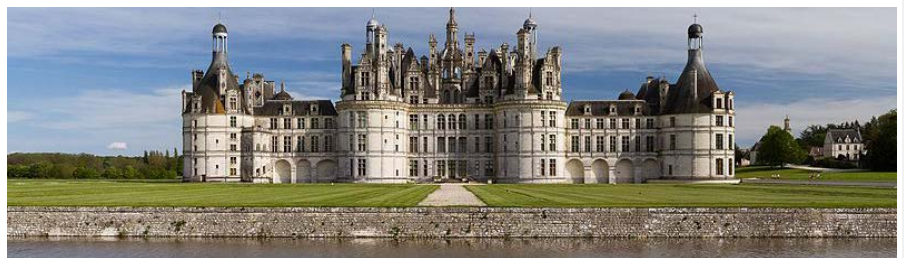
Façade Nord-Ouest du château de Chambord

«Le modèle économique de Chambord, appuyé sur le mécénat, doit être imité !»