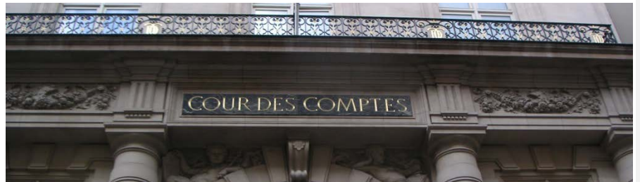
Cour des comptes