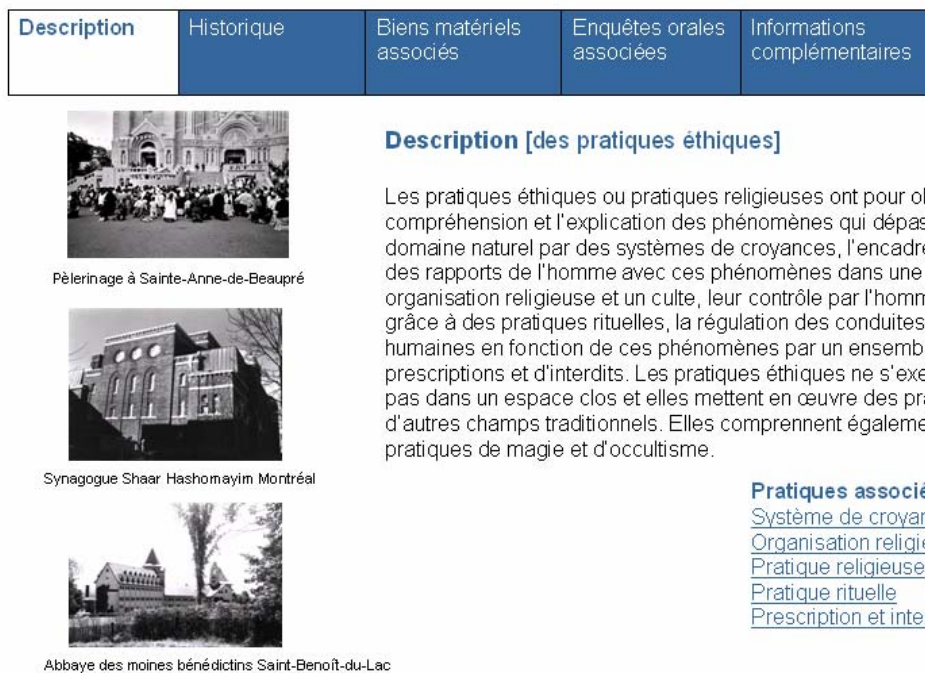
Fig. 1 : Concept de présentation d'un inventaire du patrimoine immatériel religieux : maquette illustrant le résultat d'une recherche sur une pratique culturelle.

Accueil > Résultat de la recherche > Résultat d'une recherche d'une pratique