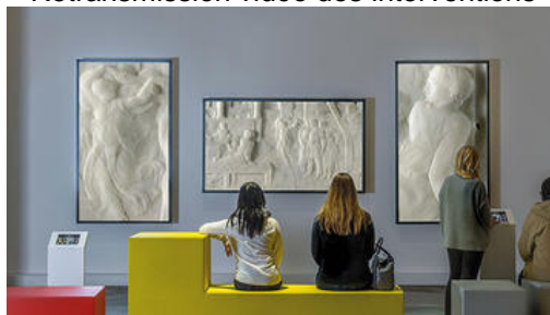
Palais des Beaux-Arts de Lille

À la suite du rapport Musées du XXI e siècle et des Assises des métiers des musées , le ministère de la Culture, en collaboration avec l'Institut national du patrimoine, ICOM France et l'Association Générale des Conservateurs des Collections Publiques de France, a organisé une journée professionnelle dédiée à la stratégie numérique dans les musées. Cette journée s'est tenue le 5 octobre 2018 à l'auditorium de l'Institut national d'histoire de l'art, 2 rue Vivienne 75002 Paris.